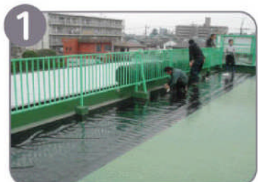
1 まず、防水用シートが敷かれます。