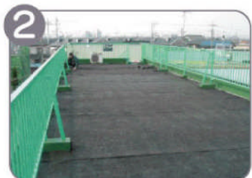
2 保護マットを敷きます。