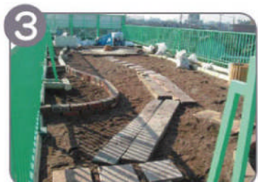
3 ルーフソイルが約10cm盛土され、庭の造園の骨格が出来てきます。