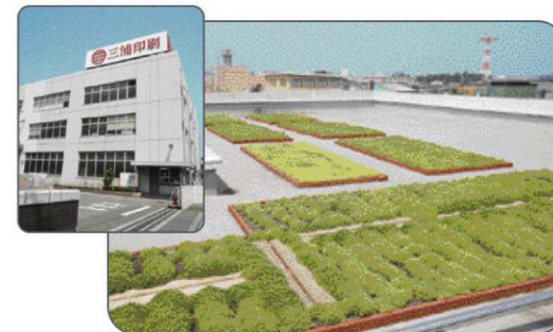
▲三浦印刷様 (船橋市)