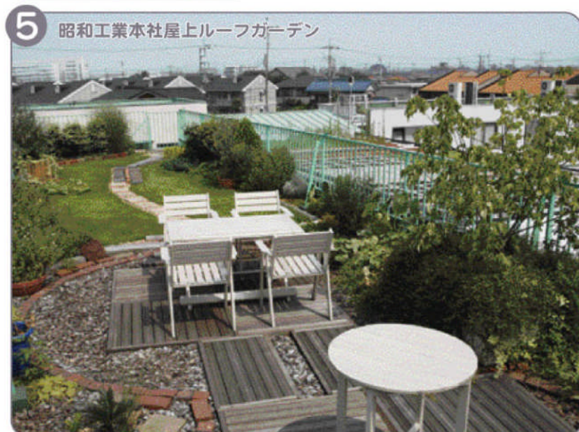
4 完成です。空中庭園の出来上がり。屋上が簡単に憩いのスペースになります。