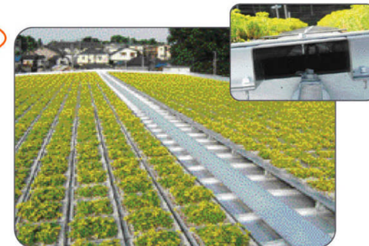
▲タキザツ漢方薬様 (さいたま市)