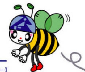
サニー 【昭和工業キャラクター】

そして、会社は社員の将来を見据え、資格取得を奨励してくれる。取得費用は全額会社持ちだし、資格を取得すれば手当も支給されるんだ。だから若い社員は資格取得にも、積極的に取り組む。資格を取得すれば自信もつくし、仕事も楽しくなるよね。会社のためにもなるし、なにより自分のためにもなるよね。昭和工業はこういう繋がりをとても大切にすることだと考えている会社なんだ。だから社員一人ひとりがのびのびと仕事に取り組みして、若い力が育つ！その力を得て会社全体が活性化していく。なんか素敵だよね！！